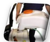
Bac à eau amovible, facile à remplir