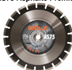
AS75 Asphalte Prémium