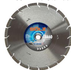
LBA 60 Mixte Standard