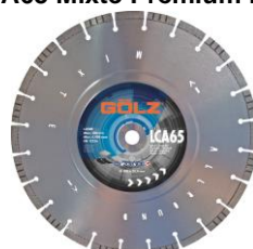
LCA65 Mixte Prémium Plus