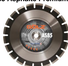
AS85 Asphalte Prémium Plus