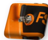
Loquet de blocage plongée