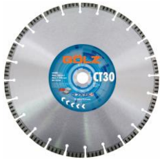
CT30 Béton Standard