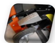
Indicateur de profondeur de coupe