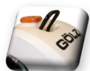
Anneau de levage