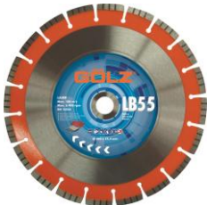
LB55 Béton Prémium