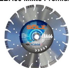
LBA66 Mixte Prémium