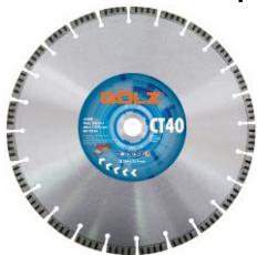
CT40 Béton Technique